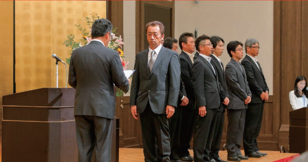
YAHAGI マイスター認定式

平成29年度安全衛生推進大会が、6月12日(月)にメルパルクNAGAYAにて開催され、矢作建設グループ役員200名・作友会員195名が参加しました。