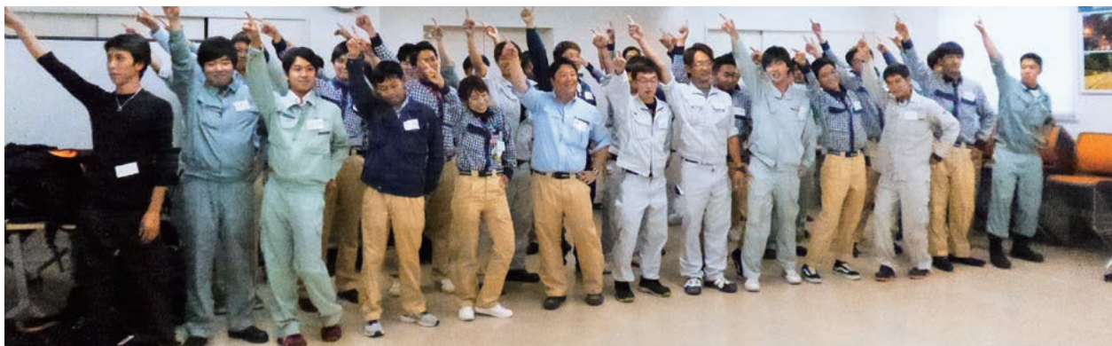
▲ 若手合同研修会の様子

それと同時に、矢作建設や作友会員 がコミュニケーションを深めるよい機 会になっています。