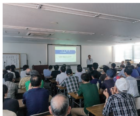
▲ 講師派遣制度の様子

今後も作友会事務局では、各部と連携しながら会員の皆様に有益な研修、勉強会を開催していきます。開催に際しては、その都度、案内を出しますので是非ご参加ください。