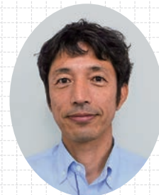
矢作建設工業(株) 建築事業本部 施工本部 施工部

当現場は、JR岐阜駅から南へ300mほどに位置し、非常に利便性の高い15階建てマンションの工事です。また、南側周辺は閑静な住宅が広がり、高層建築物がないことから、竣工後はランドマーク的な存在の物件となります。また、既に完売していることから入居される方々に喜んでいただけるよう、イメージしながら職員・協力会社一同「いいものづくり」にこだわり、無事故で竣工を迎えることができるよう取り組んでおります。