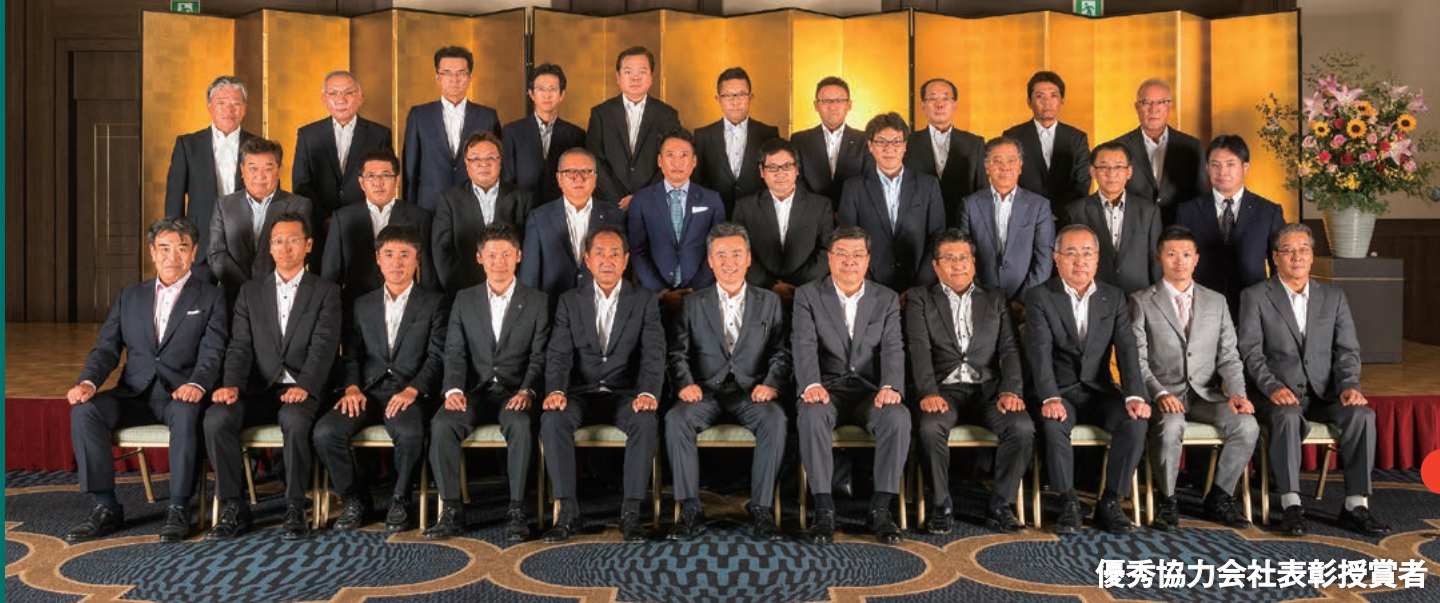
優秀協力会社表彰授賞者