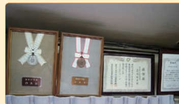
▲社内には、多くの感謝状が飾られていました!