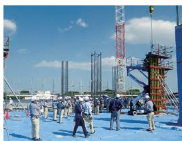
現場見学会の様子