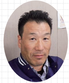
矢作建設工業㈱ 土木事業本部 土木施工本部 施工部

当現場は、三菱地所㈱発注の日本ガイシホール（旧レインボーホール）北側に位置する旧愛知県所有地（約3.1ha）の土壌汚染対策工事です。主に環境基準値を超過した揮発性汚染土（VOC）や重金属汚染土（砒素・鉛・ふっ素）約12,500㎡を場外に搬出処理する工事と、それに伴う遮水壁工事としてセメント地中連続壁（SMW）及び止水鋼矢板圧入を行っています。まもなく汚染土の撤去が完了し、当社施工による物流倉庫建築工事が始まります。現在、建築着工に向け、無事故無災害、工程遵守、そして近隣対応に細心の注意を払い、日々施工しています。