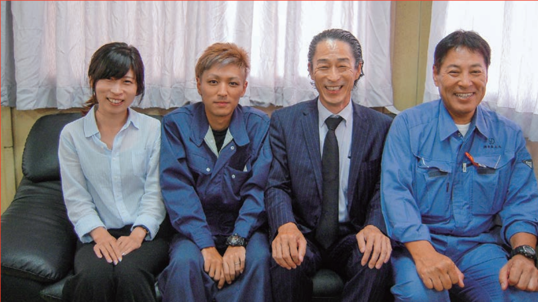
▲(株)新高土木の皆様

毎号連載の『会員企業訪問 Report』!! 今回は鉄道部会所属の新高土木さんにお話を伺いました。