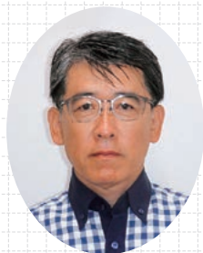
矢作建設工業(株) 土木事業本部 鉄道施工本部 鉄道部