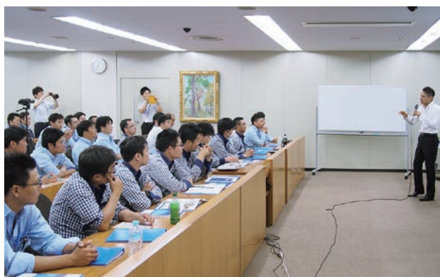
▲ 建築専門工種合同勉強会の様子