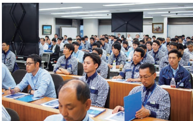
▲ 建築専門工種合同勉強会の様子

ここで学んだことを現場で実践することで、元請も協力会社も互いにメリットが得られると思います。