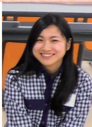
矢作建設工業株式会社 建築事業本部 設計本部 第一設計部 職種：設計 経験年数：半年

小学生の頃から空間に興味があり、多くの建築物を見てくうちに、私もこんなものを造りたいと思うようになりました。小さい頃からの夢ですね! まだまだできないことやわからないことばかりで、もっとやりたいのに時間が遅くなってしまったり、退社することもあります。これからより多くの現場を見たり、もっともっと勉強して経験を積んでいきたいです。