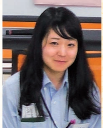
矢作建設工業株式会社 土木事業本部 土木施工本部 施工部 職種：現場監督 経験年数：半年

モノができあがっていく様子を目の前で見るのができて楽しそうだと思い、建設業に興味を持ちました。近年少しずつ女性技術者が増加していて、頑張っている方がたくさんみえるので、私にもできるかなと思って選びました! 実際に働いてみると、トイレや更衣室、空調服など設備が整っていて、現場はとても綺麗。一般的には汚いイメージがあると思いますが、そこが良い意味でのギャップでした。建設業は、キツイ、コワイというイメージが大半だと思いますが、いざ働いてみるとそれを上回るほど毎日楽しくて勉強の連続! 女性だからできないというのは悔しいので、日々努力もしています。今後現場監督を目指す女性に、この楽しさを伝えたいですね。