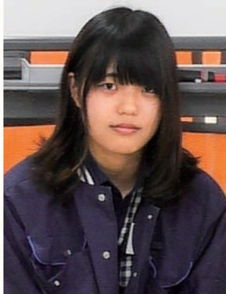
矢作建設工業株式会社 土木事業本部 土木施工本部 施工部 職種：現場監督 経験年数：半年

男性と比べられている部分はあると思うけれど、負けないよう努力しなければならないですね。男性と女性ではできることに差があり、悔しいときもあります。そこは割り切って自分ができるところを一生懸命やるのが大切だと思っています。現場を綺麗にしたり、倉庫や休憩所では男性が気付かないような細かいところにまで目を向け、皆さんが使いやすいように整理整頓や清掃をしたり。自分の居場所をそのようにつくっていければいいと思います。