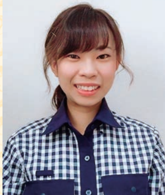
矢作建設工業株式会社 建築事業本部 施工本部 施工部 職種：現場監督 経験年数：半年

多くの人と関わりながら皆でひとつのモノを造り上げていく仕事だと知り、魅力を感じました。多くの方からいろいろなことを教わって自分の成長につなげ、できあがったときの感動を味わいたいと思い、施工管理職を選びました。一般的には、3K(危険キツイ汚い)というイメージがあると思いますが、実際の現場では、助けてくださる方がたくさんいます。働き始めて苦勞していることは、重いものや大きいものが運べないことや高いところに手が届かないことなどです(笑)。建設業は女性が働きにくいイメージがあるかもしれませんが、そんなことはありません! 女性ではできないことがある分、女性にしかできないこともたくさんあると思うので、注意書きや掲示物ひとつでも、自分なりの工夫をして強みを生かしていきたいです。